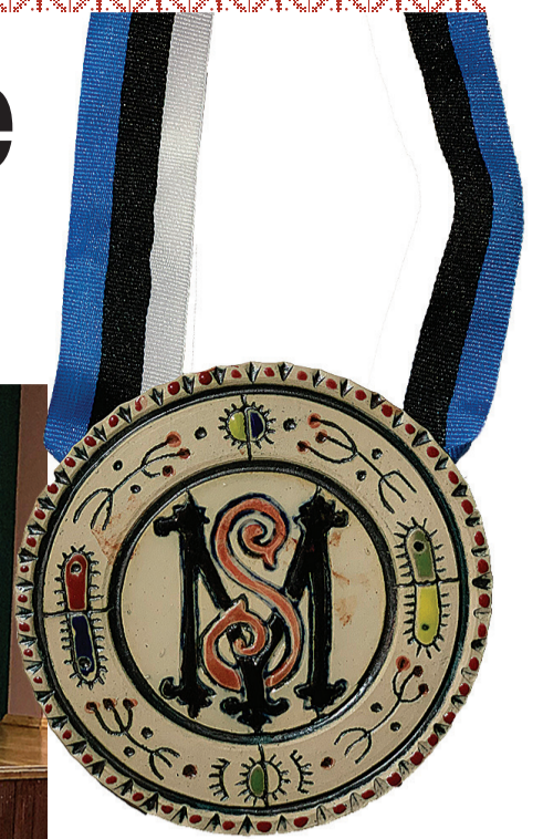
Mulke Seltsi vanembe ammatiraha mõtel vällä ja tei valmis Allikvee Külli. Pilt: Saare Madli

Mede tegemisi toet äste rahage Mulgi perimuskultuuri rogramm ja regionaalse kultuuritoetuse rogramm. Tänu neile olli meil mede suurmeeste sündümise aastepäeve jaos raha